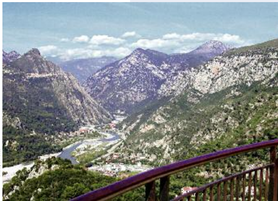
Panorama (côté Nord) offrant une vue sur le Mercantour

Là, vous découvrirez un panorama à couper le souffle. Au loin devant vos yeux la mer, et en faisant un demi-tour, les pré-Alpes. A vos pieds, à pic, le fleuve Var rafraîchit sa vallée. Prodigeux.