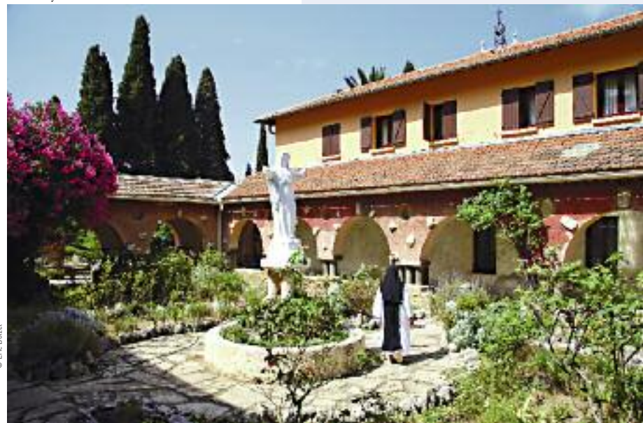
L'Abbaye Notre-Dame de la Paix

fontaines méritent une visite ainsi que le moulin à huile au quartier des moulins.