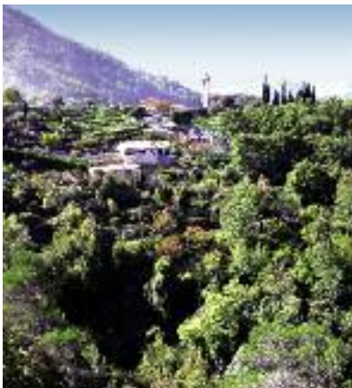
Vue du village

centrale du village et de gravir quelques marches pour visiter ce témoin des temps anciens qui apprend tout des mécanismes et des gestes d'autrefois. L'ensemble a été conservé dans l'état d'origine. On peut admirer la grande roue à godets entraînée par un petit filet d'eau, les meules en pierre, les engrenages en bois et la presse. Habile transition entre tradition et modernité, les salles adjacentes accueillent régulièrement en période estivale des artistes locaux et étrangers qui exposent leurs œuvres. En quittant l'historique moulin, le regard se pose d'abord sur les bassins de décantation, disposés en escalier,