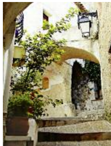
Les venelles du Masage

Le Masage est le plus ancien du village. Maisons séculaires, ruelles pavées, passages voûtés et