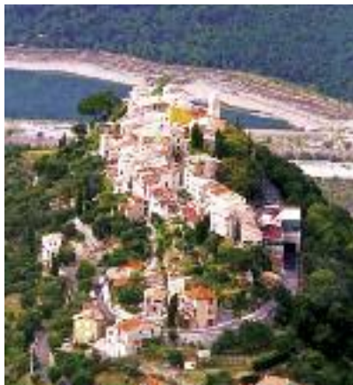
Le nid d'aigle

médiévale qui surgit au détour d'un virage. Sa situation dominante sur la vallée du Var et son emplacement géographique laissent imaginer que l'histoire a forgé ici des caractères forts.