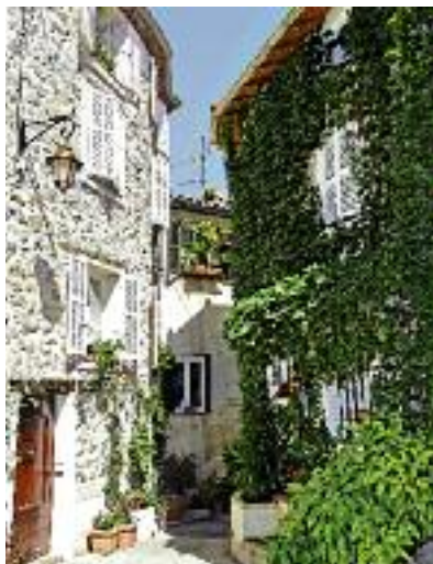
Ruelle du village

cette colline est le point de départ d'un circuit qui permet de faire connaissance avec le riche passé de l'ancienne cité. En empruntant d'étroites et fascinantes ruelles, vous admirerez l'église paroissiale, la porte de l'ancien château, les pontis et les fontaines, le "boutaù", les places, la Maison du Portal. Avant de cheminer jusqu'aux Chapelles des Pénitents Noirs et des Pénitents Blancs, vous traverserez la place de la République, le jardin public et le square Masséna d'où la vue est prodigieuse. Cela vous incitera à emprunter l'un des nombreux sentiers de randonnées qui accèdent depuis Levens à des