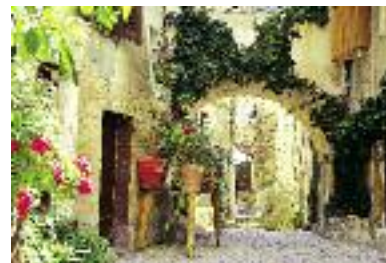
Une ruelle pavée