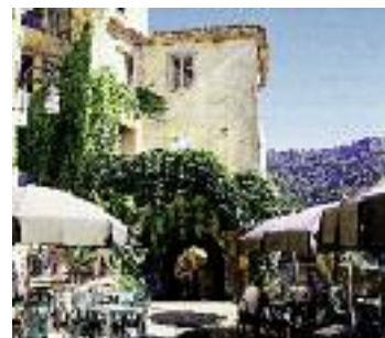
Placette du village

son panorama et ses couleurs. Extraordinaire privilège, elle s'est dotée en 1949 d'un jardin merveilleux qui descend des ruines du château à la mer. Bien abrité des vents du nord, drainé efficacement par sa déclivité, le Jardin d'Eze est un paradis dans lequel les espaces de détente, l'art, l'histoire et plus de quatre cents plantes succulentes se donnent rendez-vous. Dès l'entrée, la vue féerique mérite que l'on s'attarde. On est à 429 mètres au-dessus de la Méditerranée, une plaque d'orientation permet de situer l'Italie, la Corse et Saint-Tropez. On emprunte ensuite les parcours