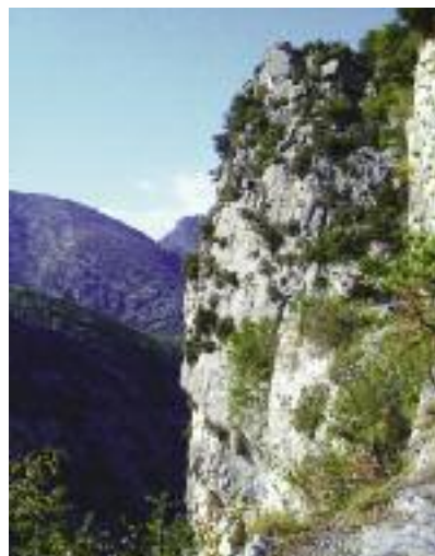
Le Belvédère du Saut des Français

Contrastant avec la douceur des oliveraies qui entourent Duranus, le site magnifique et sauvage du belvédère du Saut des Français est