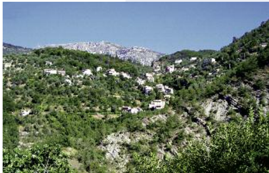
Vue du village depuis la route de Levens

lieux touristiques des environs de Nice. C'est aussi l'une des fiertés de ce petit village perché qui, outre ses nombreux atouts culturels et géographiques, possède une autre curiosité, une ancienne mine d'arsenic exploitée de 1902 à 1931.