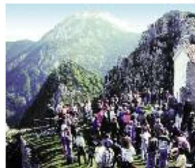
Pèlerinage à la chapelle Saint-Michel

Voici qui explique le nom donné à ce belvédère, l'un des hauts