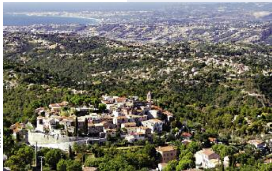
Vue du village depuis le col d'Aspremont

magnifique réhabilitation. C'est enfin la Chapelle Notre Dame des Salettes, bâtie entre les XIII e et XVIII e siècles, qui s'offre à son regard, dominant un paysage impressionnant. Tant de beautés architecturales vouées à la spiritualité dans un si petit périmètre expriment une étonnante singularité.