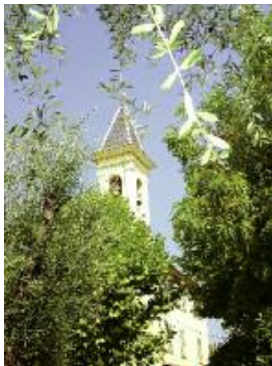
Eglise de la Madone

Dans la tranquillité de son site, vignes, œillets et oliviers ont construit sa notoriété. Aujourd'hui, l'olive est certainement son plus beau trésor. Les oliviers - les fameux caillietiers du Pays Niçois - que l'on aperçoit en approchant du village appartiennent à son paysage depuis des décennies.