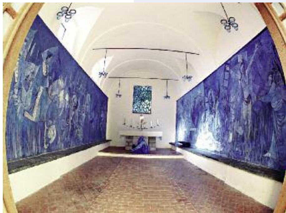
La Chapelle Bleue

authentique. En vous promenant dans ce vieux village où tout se fait à pied, vous découvrirez les ruelles pavées de galets entrecoupées de placettes fleuries et les fameux “pontis”, appellation en niçois des passages voûtés ou couverts.