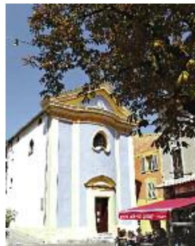
Chapelle des Pénitents Blancs

cette colline est le point de départ d'un circuit qui permet de faire connaissance avec le riche passé de l'ancienne cité. En empruntant d'étroites et fascinantes ruelles, vous admirerez l'église paroissiale, la porte de l'ancien château, les pontis et les fontaines, le "boutaù", les places, la Maison du Portal. Avant de cheminer jusqu'aux Chapelles des Pénitents Noirs et des Pénitents Blancs, vous traverserez la place de la République, le jardin public et le square Masséna d'où la vue est prodigieuse. Cela vous incitera à emprunter l'un des nombreux sentiers de randonnées qui accèdent depuis Levens à des