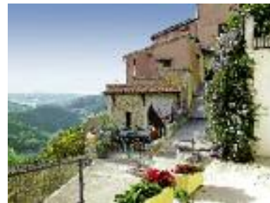
Ruelle du village plein sud