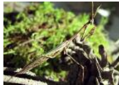
Empuse (Empusa pennata)