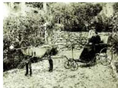
La Reine Victoria et son âne Jacko vers 1890

Cette douceur exquise séduisit en son temps la Reine Victoria. Elle y venait régulièrement en calèche pour apprécier le calme des après-midi et déguster son thé. La place du “Thé à la Reine” rend hommage à sa célèbre visiteuse qui n’était certainement pas insensible à la vue exceptionnelle que l’on a sur Nice, en particulier du plateau Bellevue. Là, vous aurez plaisir à vous asseoir un instant sous le grand chêne centenaire, pour