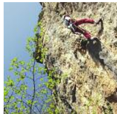
Escalade du Baou

Les sportifs qui pratiquent cette discipline peuvent l'exprimer ici