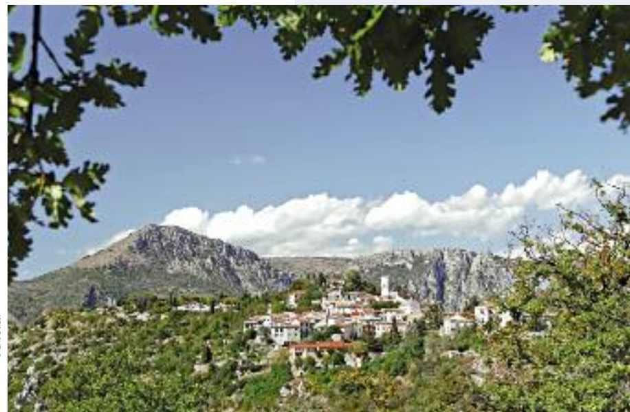
Levens dans son écrin de verdure

lieux enchanteurs. Le cœur vert de Levens bat aussi pour ses célèbres Grands Prés qui font le bonheur des enfants et des promeneurs. Ce vaste espace de verdure est l'univers des sportifs, quelle que soit leur discipline, qui se régale d'immensité et de grand air. Les Grands Prés accueillent régulièrement les grandes manifestations de Levens.