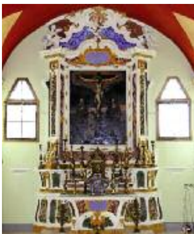
Chapelle des Pénitents Blancs

dominant, donnent tout son sens au nom du village qui signifie "âpre" et "aride", et à sa devise "asper sed liber" ("âpre mais libre"). Aspremont possède un patrimoine religieux rare que le promeneur peut découvrir pas à pas. En arrivant sur la place centrale, il admire la Chapelle votive Saint-Claude édifée en 1632 pour conjurer la peste. Il emprunte ensuite un escalier fleuri jusqu'à l'Eglise Saint-Jacques le Majeur qui date du XVI e siècle et se distingue par une nef gothique sans fenêtre. A deux pas, rue Marius Ferrier, la Chapelle des Pénitents Blancs (XVIII e siècle), témoigne d'une